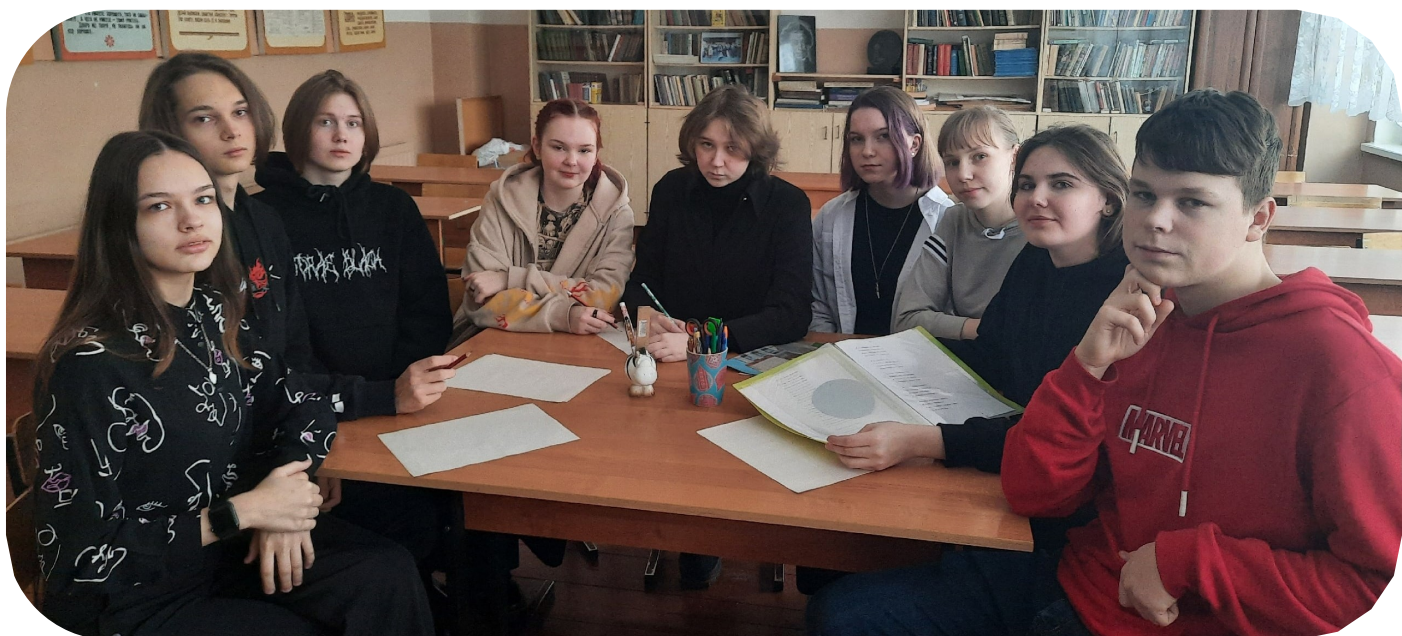
Над выпуском работали: Никита Черницкий, Таня Долженко, Вероника Гавриш, Дарья Романова, Аня Пангаева, Настя Теровская, Владимир Андронов, Андрей Костюкевич, София Балыко