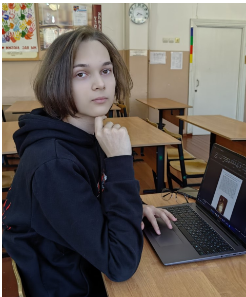
Технический редактор: Семён Стасюк