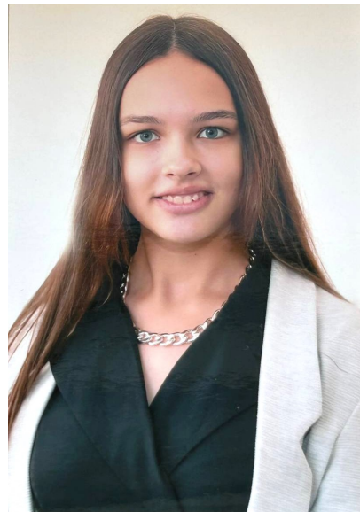
Редактор: Елизавета Семенова